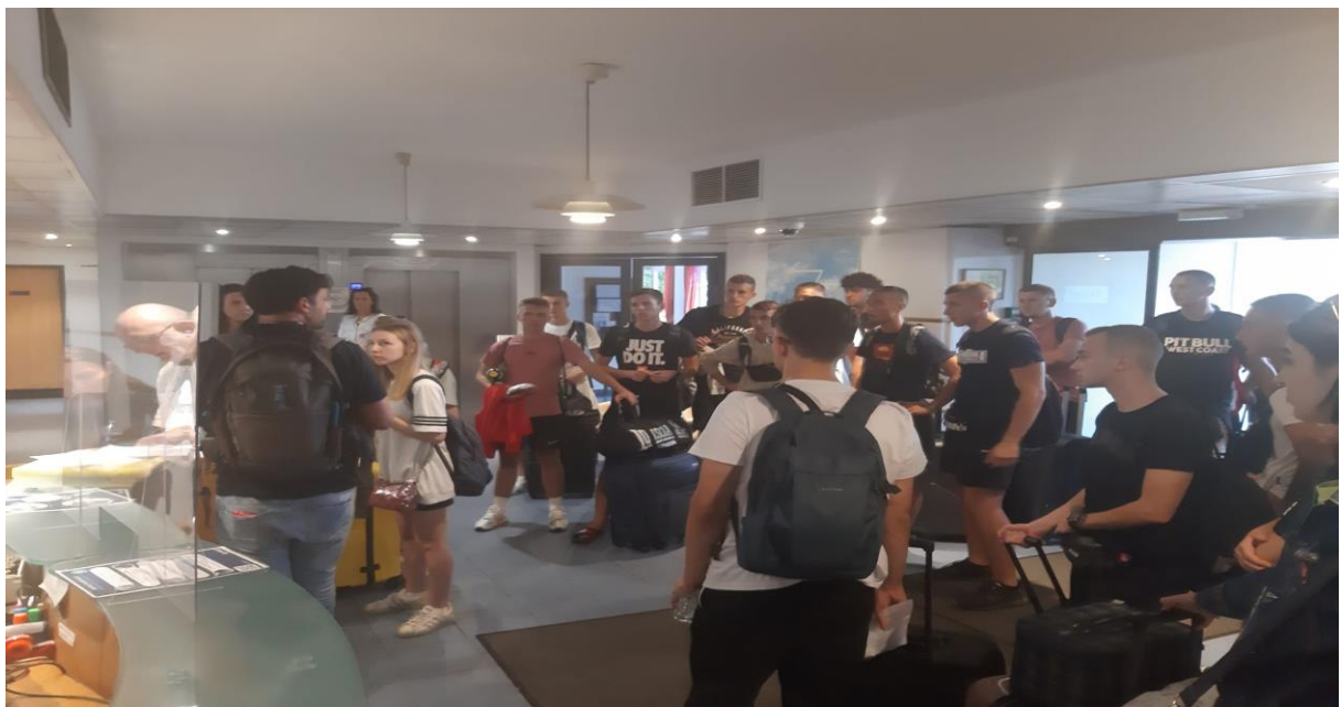
Ujutro smo imali doručak u hotelu Kyriad.